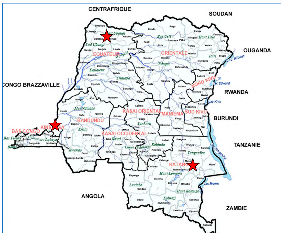
Les provinces couvertes par HPP-Congo sont marquées par une étoile rouge. Il s'agit des provinces du Katanga, de l'Equateur et de la Ville/Province de Kinshasa.